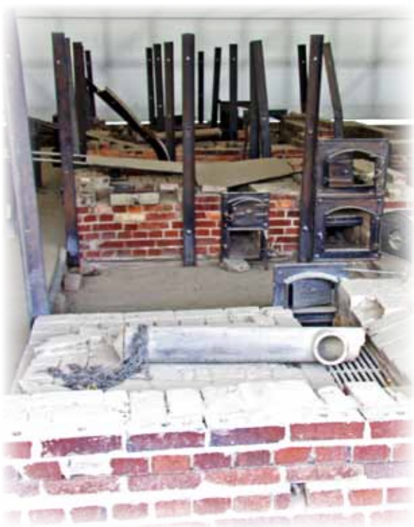
Krematorium w Sachsenhausen.